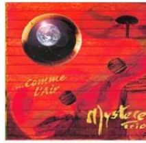
Comme l'air 2003