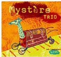
Sérieusement live 2006