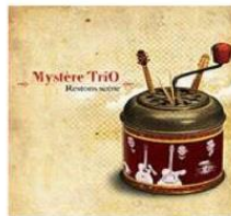
Restons scène 2011