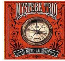
Du nord au swing 2011